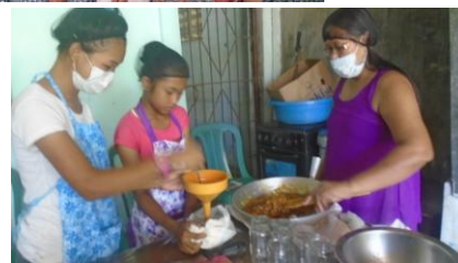
Confection de confitures