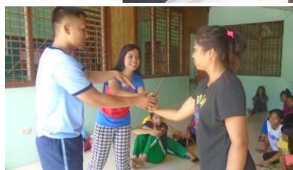
Stage de self-defense