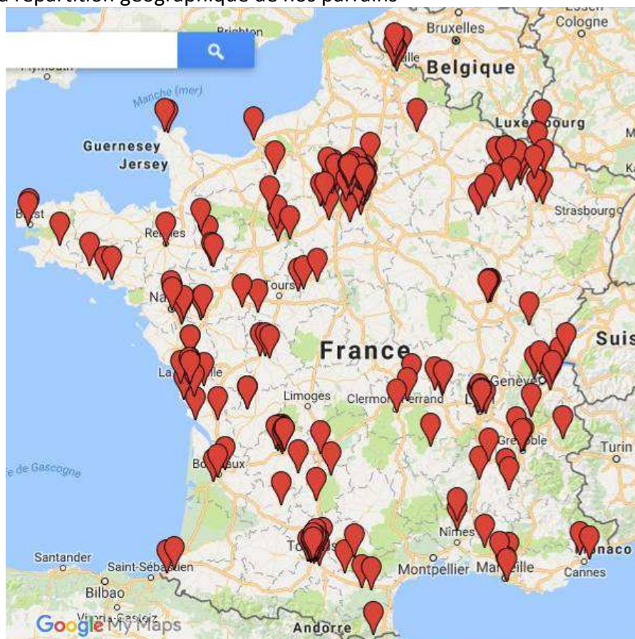
Répartition géographique des parrains/marraines métropolitains.

Présentation de la répartition géographique de nos parrains