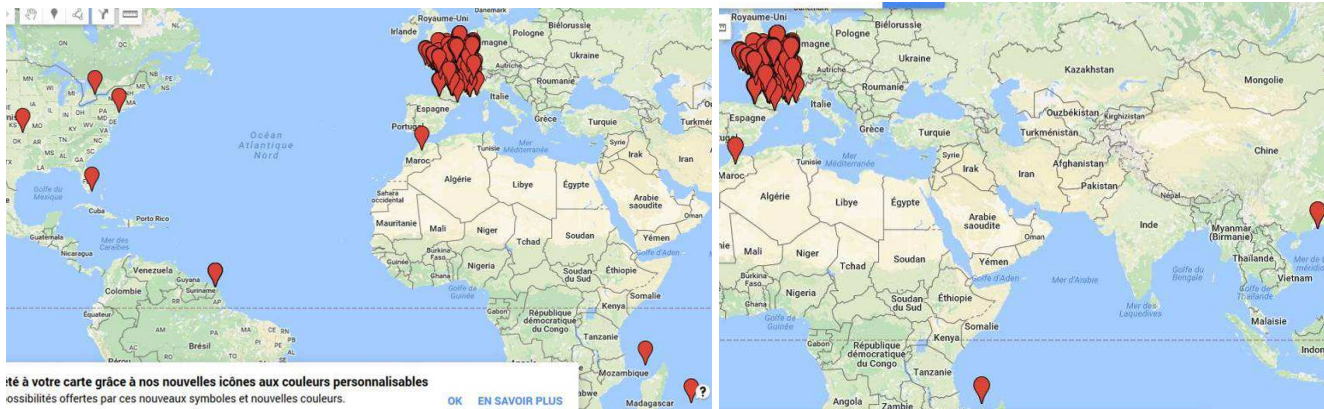
Répartition mondiale des parrains/marraines.