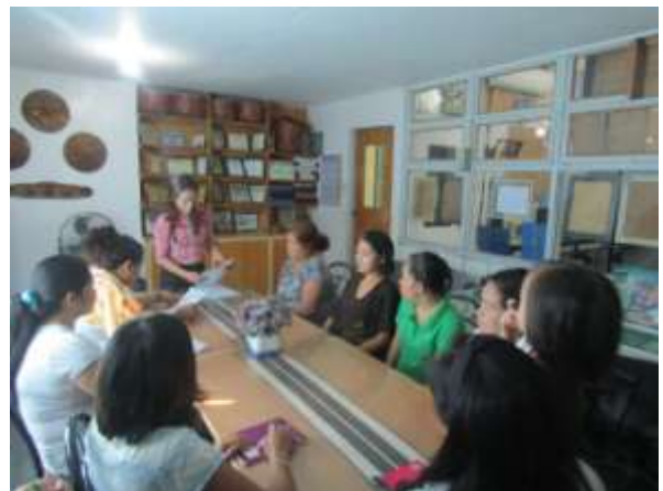
Réunions avec les bénéficiaires du projet.