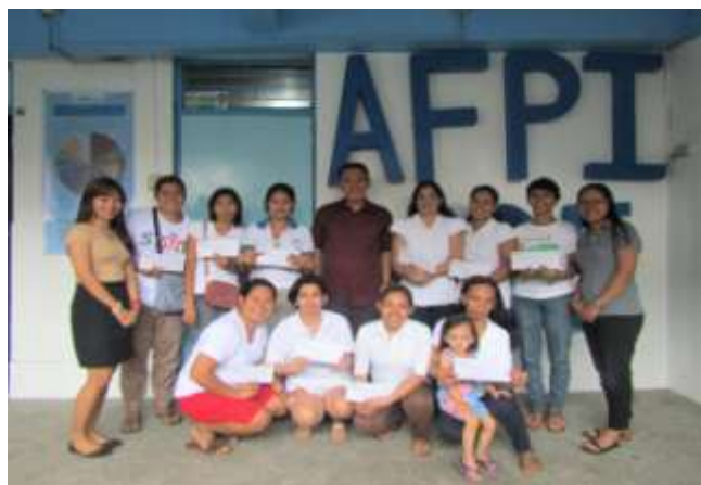
Attribution des prêts